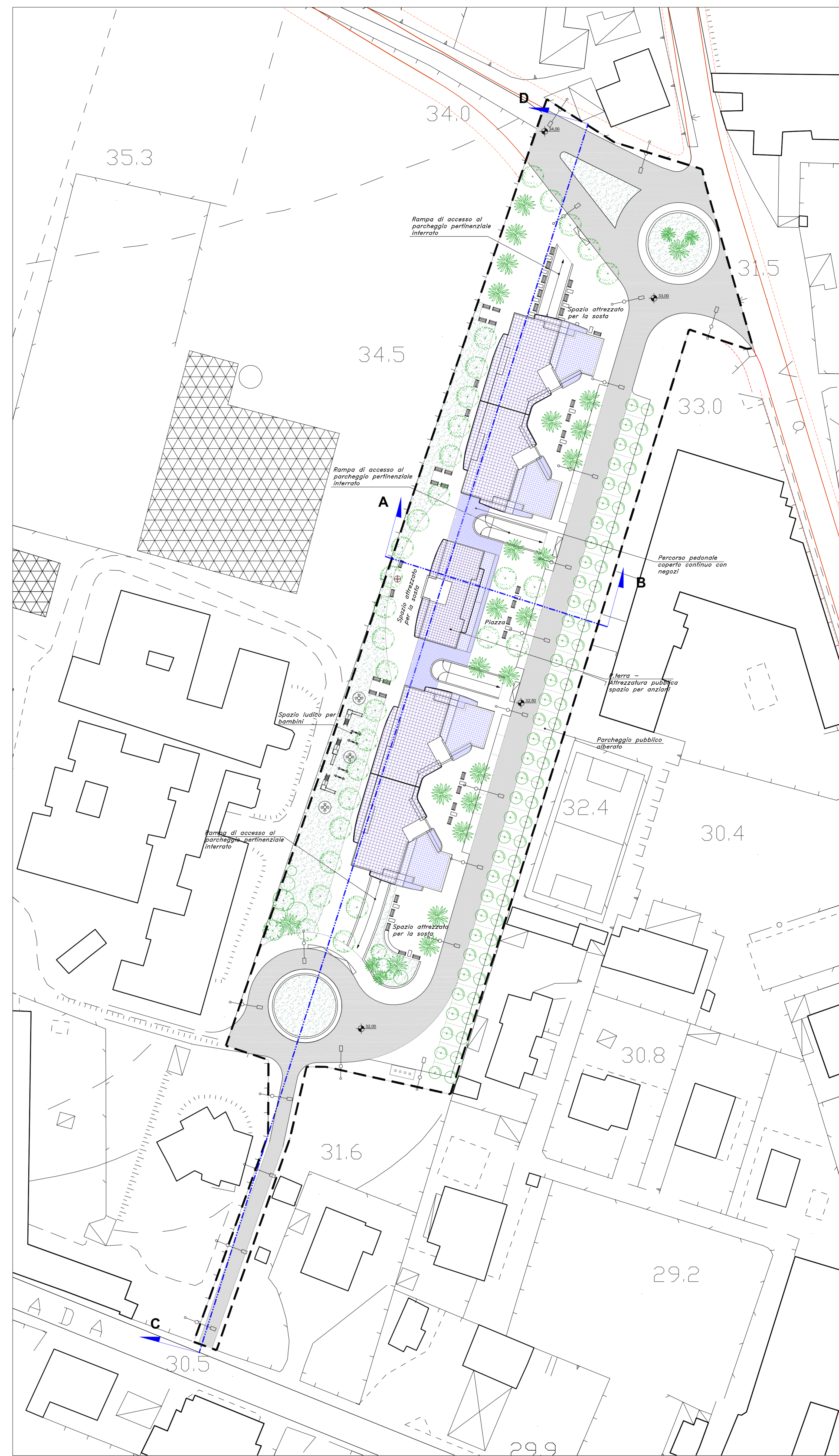
PLANIMETRIA PIANO TERRA - SISTEMA DEI PERCORSI PEDONALI